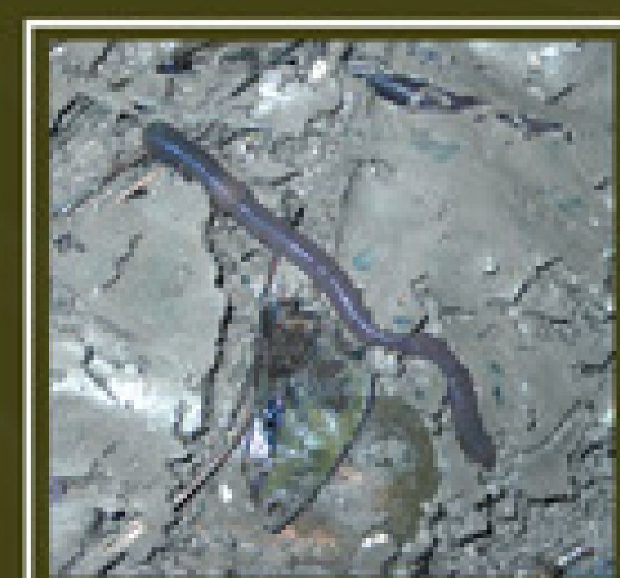
lombriz, uno de los alimentos preferidos por la tenca

La tenca es un pez de la familia cyprinidae originario de Europa que habita las zonas con fondo blando y abundante vegetación acuática. Se alimenta de invertebrados que captura en el fondo y a los que detecta con sus cortos barbillones. Ingiere gran cantidad de lodo con la comida. La aleta caudal se encuentra en un fuerte pedúnculo ancho y es de corte casi recto, sin la característica hendidura de las colas de pescado que son propias de su familia. Parece ser que no es autóctono de Aragón y es introducida con repoblaciones artificiales por la administración autonómica.